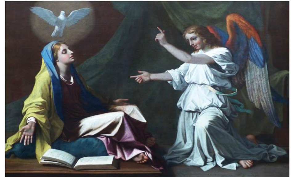
Nicolas Poussin, Die Verkündigung, 1657

25. März. Fest der Verkündigung des Herrn. Gott ist am Werk.