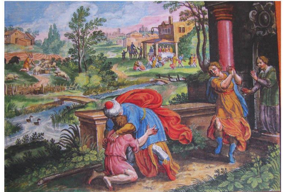
Matthäus Merian der Ältere

Mich hat das immer beeindruckt: Der Vater lässt den verlorenen Sohn noch nicht einmal ausreden – er hat ihn einfach umarmt. Der Sohn hatte sich schon eine Rede zurechtgelegt, aber der Vater hat ihn einfach umarmt!